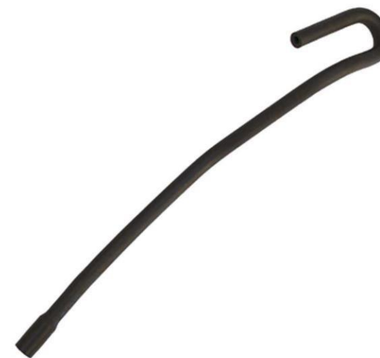
شیلنگ بخار روغن از قالباق سوپاپ به منیفولد