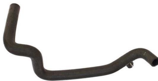
شیلنگ خروجی از منبع انبساط ۲۰۶