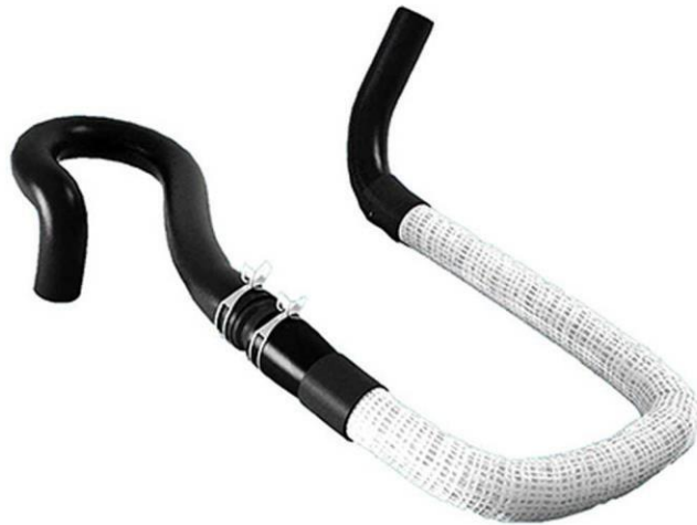
شیلنگ خروجی آب رادیاتور بخاری R2