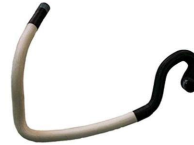
شیلنگ خروجی آب رادیاتور بخاری