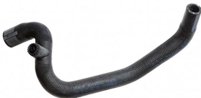
شیلنگ خروجی آب با پیچ هواگیر