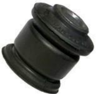
بوش بالا سر کمک پژو ۲۰۶