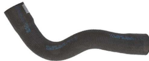
شیلنگ ورودی آب رادیاتور