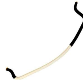
شیلنگ پمپ هیدرولیک فرمان R2