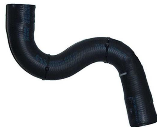
شیلنگ ورودی آب رادیاتور X12