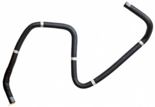
شیلنگ پمپ هیدرولیک فرمان