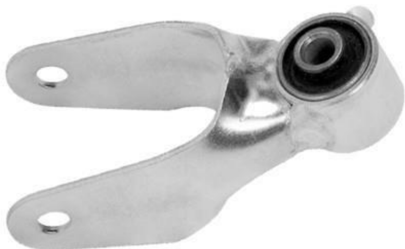
پایه دوشاخ رانا