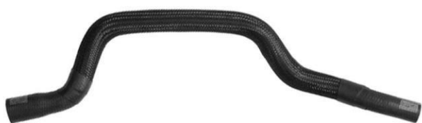
شیلنگ ورودی آب پژو