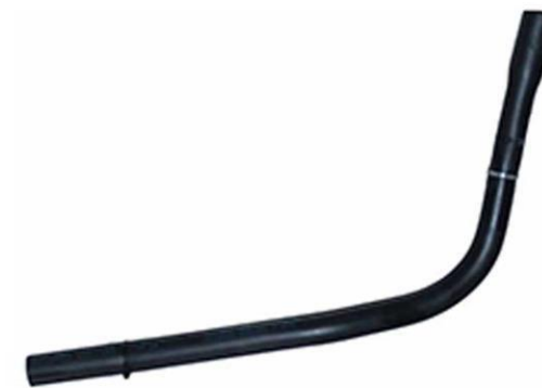
شیلنگ ورودی هوا به هواکش خانواده پراید