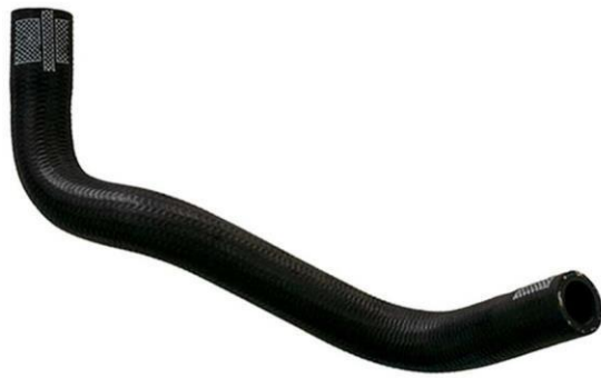
شیلنگ خروجی ۲۰۶