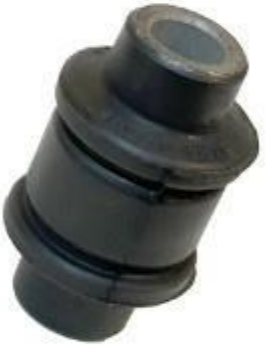
بوش پایین سر کمک پژو ۲۰۶