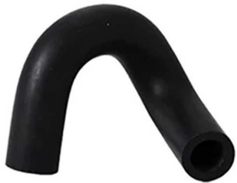
شیلنگ درب قالیاق سوپاپ انژکتور پراید پراید