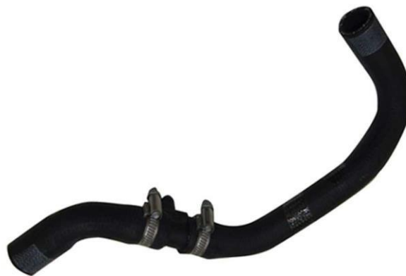
شیلنگ آب رادیاتور گازسوز