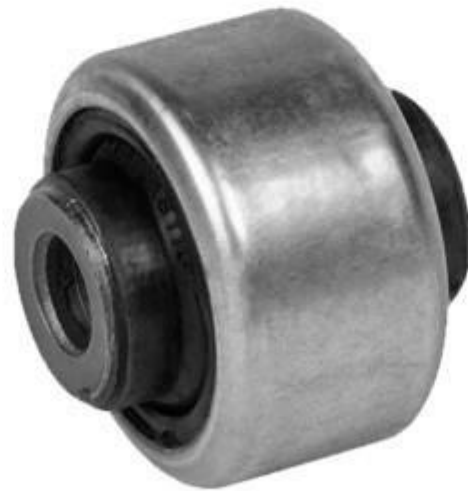
بوش طبق مشترک پژو ۲۰۶