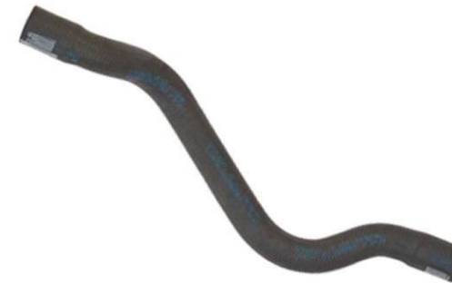
شیلنگ آب رادیاتور EF7