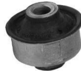
بوش طبق پژو ۲۰۶ TU3