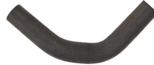
شیلنگ ورودی آب رادیاتور پراید خانواده پراید