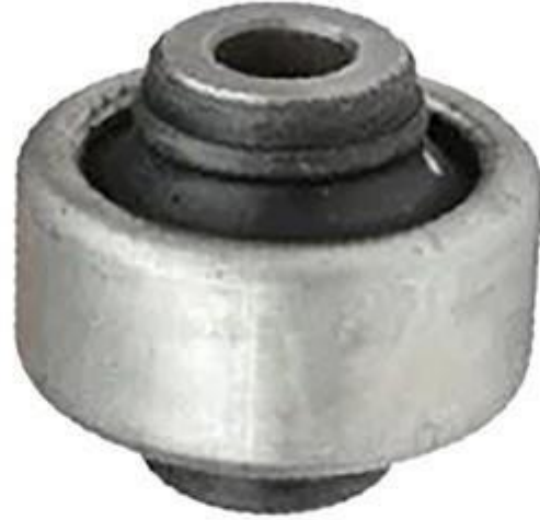
بوش طبق پژو ۲۰۶ TU5