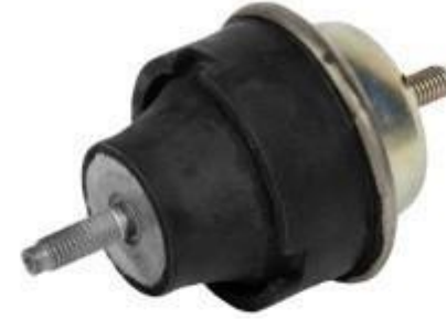
دو سر پیچ پژو ۲۰۶ TU3