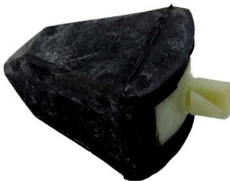
لاستیک ضربه گیر اکسل عقب به بدنه