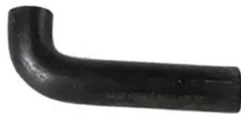
شیلنگ آرامش پراید پراید