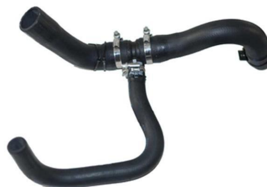
شیلنگ خروجی آب رادیاتور X12