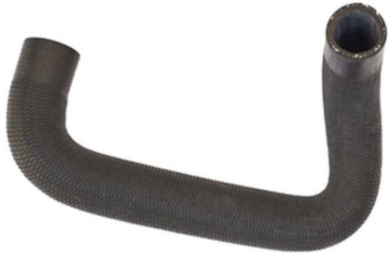
شیلنگ خروجی آب رادیاتور پراید یورو ۴ خانواده پراید