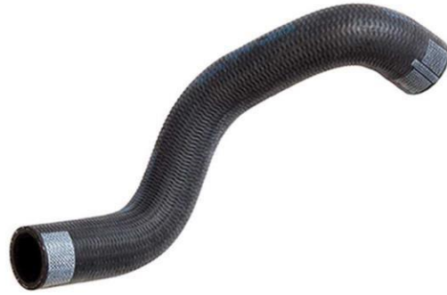
شیلنگ ورودی آب رادیاتور R2