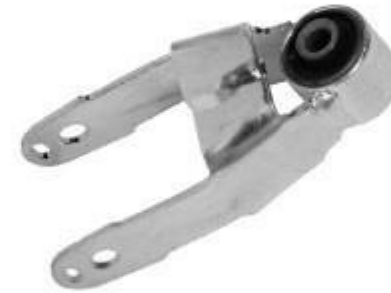
پایه دوشاخ پژو ۲۰۶