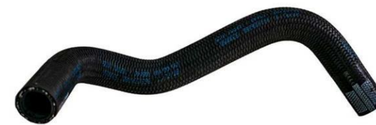
شیلنگ خروجی از منبع انبساط