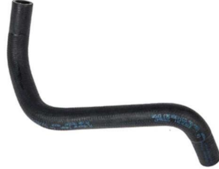
شیلنگ راست آب بخاری پراید انژکتوری پراید