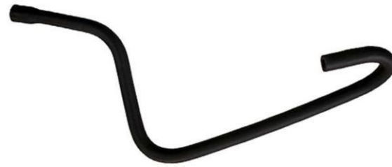
شیلنگ بخار روغن از قالباق سوپاپ به منیفولد