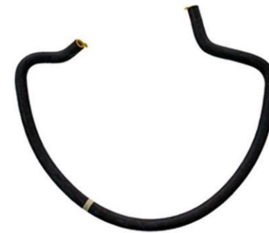
شیلنگ پمپ هیدرولیک فرمان