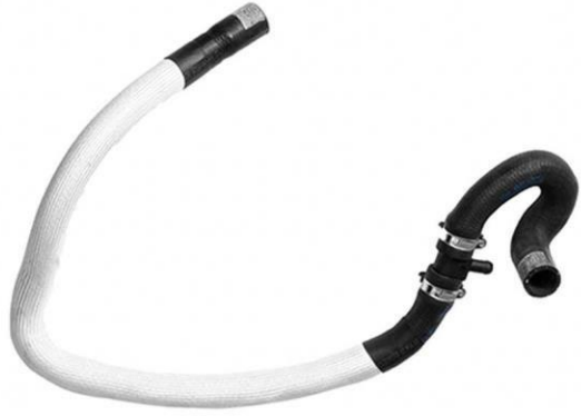
شیلنگ خروجی آب رادیاتور بخاری CNG