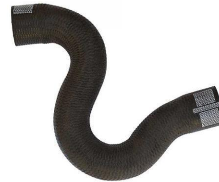
شیلنگ ورودی آب رادیاتور