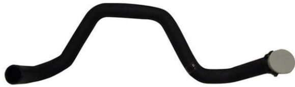
شیلنگ خروجی آب رادیاتور