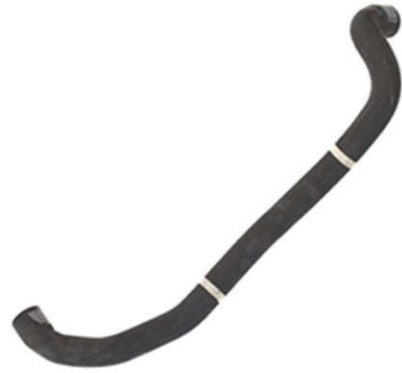
شیلنگ خروجی آب رادیاتور