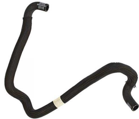
شیلنگ ورودی آب رادیاتور به خنک کننده گیربکس اتوماتیک