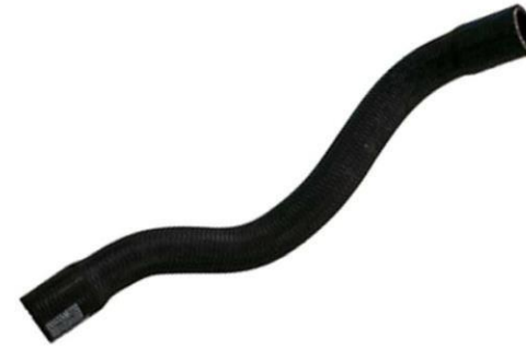
شیلنگ خروجی بخاری