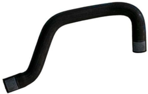
شیلنگ آب رادیاتور