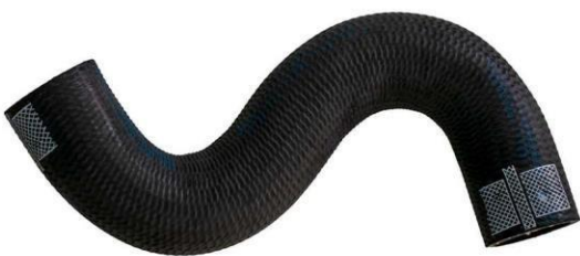
شیلنگ ورودی آب رادیاتور