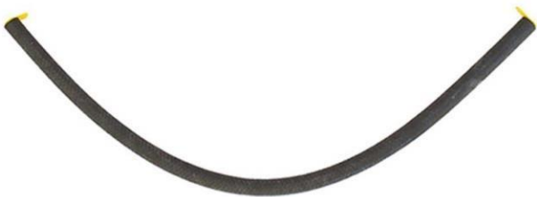
شیلنگ فشار قوی پمپ هیدرولیک فرمان