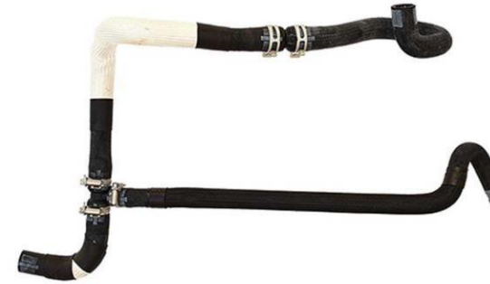
شیلنگ خروجی آب مبدل گیربکس