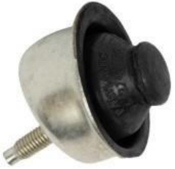
لاستیک ضربه گیر طرفین چپ پژو ۲۰۶